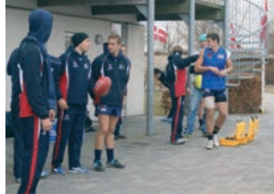
Før kampen er der nogen som varmer op mens andre hyggesnakker.

Læs mere om Australsk Fodbold her: Den danske liga: www.daf1.dk Den europæiske liga: www.afleurope.org Den australske liga: www.com.au