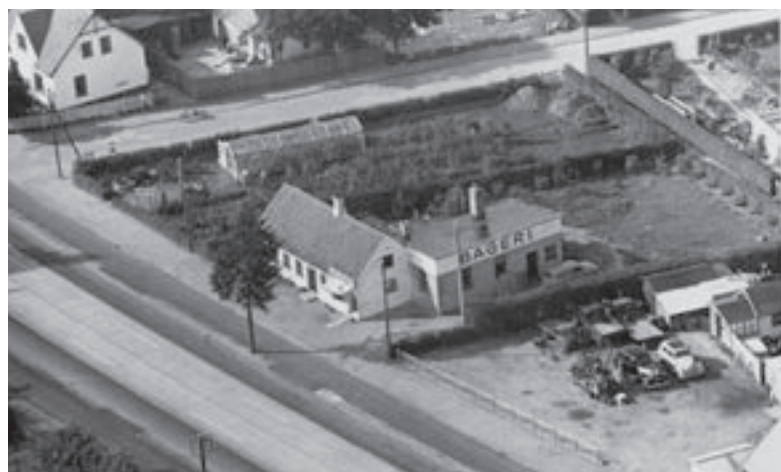
Bageren på Køgevejen nr. 710 hvor der nu er pizzeria. Nedenfor til højre ses autoværkstedet som lå der frem til midten af 1950-erne. Vejen oven for er Pilevangen.