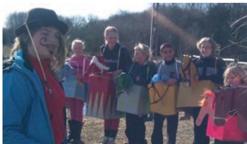
Cirkusdirektøren viser publikum hvad de talentfulde heste kan