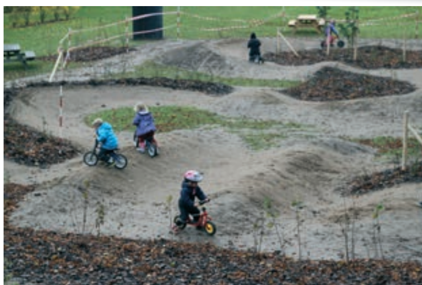
Der er mange måder at bevæge sig på – og få røde kinder og frisk luft! Billedet er fra cykeludfordringsbanen langs Vestvolden i Brøndbyøster.

Spørgeskemaundersøgelsen finder sted i hele landet. 300.000 borgere over 16 år i Danmark har fået tilsendt spørgeskemaet. Det er vigtigt at kunne se, om der er regionale forskelle og at kunne se forskelle kommunerne imellem.