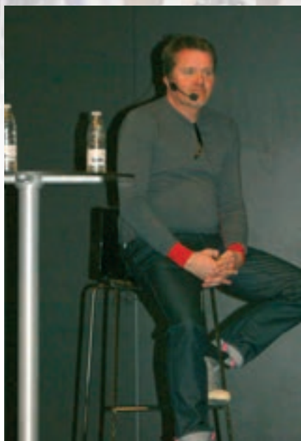
Rolf Sørensen fortæller om en oplevelse fra Tour De France