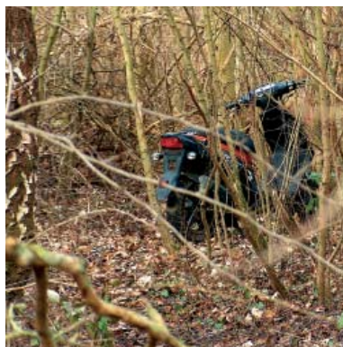
Sofaer, køleskabe og her en skrællert knallert viste sig i skovbunden.

Brøndby Kommune overtog området fra ejendomsselskabet Freja A/S (Københavns Kom-