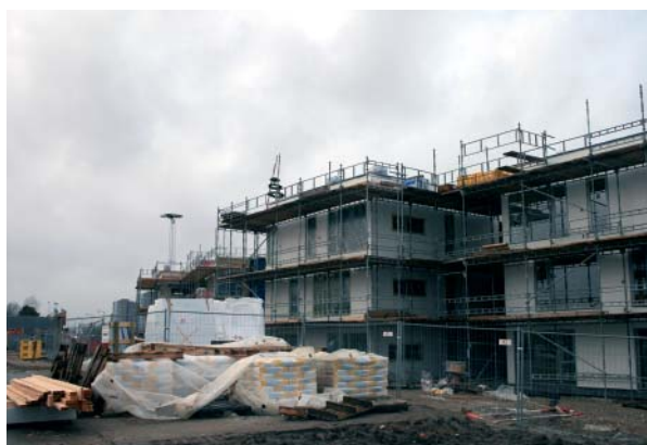
Ejerboligerne i Esplanadeparken lukker snart op for de første indflyttere.