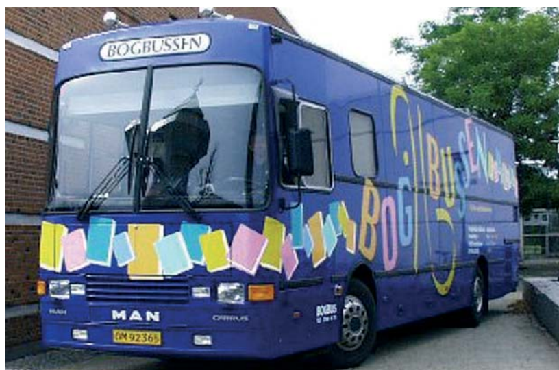
En sådan bogbus kunne være en midlertidig løsning.

Der bliver nedlagt en række filialer og bogbusser rundt om-