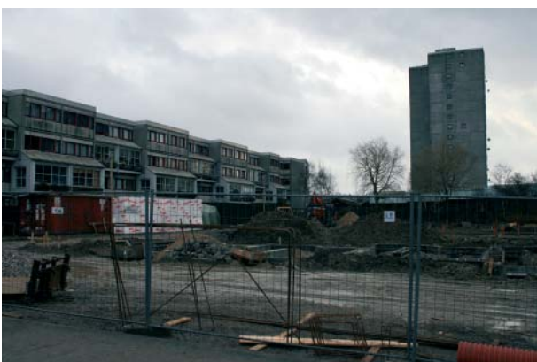
Efter en masse „banken-pæle-i-jorden“ - aktivitet kan vi nok forvente, at såvel blomster som 12 seniorboliger snart spirer i Hallingparken på den grund, der tidligere husede institutionen SVALEN.