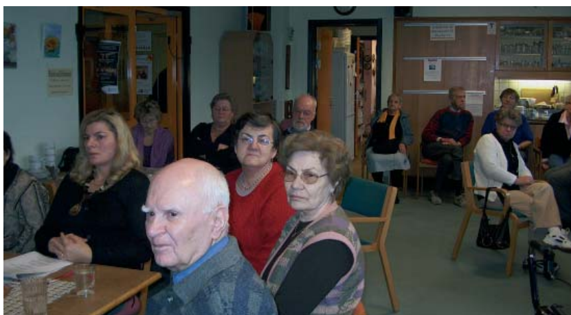
Strandstuen brugere fulgte opmærksomt med i foredragene.

Dette kan den praktiserende læge vejlede om. Motion er også meget vigtigt, helt ned til en enkelt gåtur om dagen virker. Ω