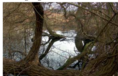
Vildtvoksende træer og buske omkranser og skæmmer den lille sø.

Men, bortset fra en oplysning om at kommunen kom til at hænge på affaldsdyngen, selv om det på daværende tidspunkt var statslig jord, så har det ikke været muligt at finde nærmere oplysninger om den unge mands indsats. Så er der nogle af dette blads læsere, som kan huske historien nærmere - et navn, et nærmere tidspunkt o.l. så hører vi meget gerne om det. \Omega