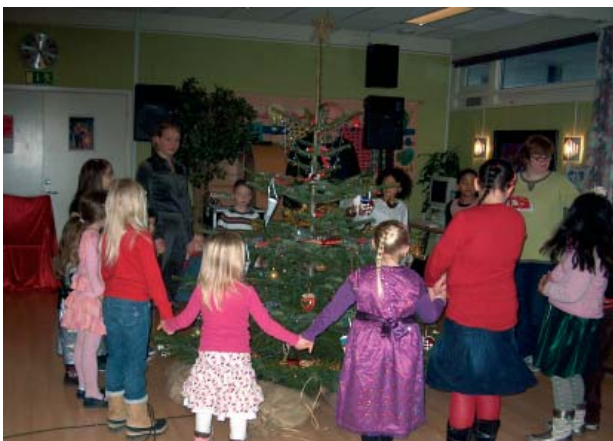
Glade børn synger og danser om juletræet i Tranen.