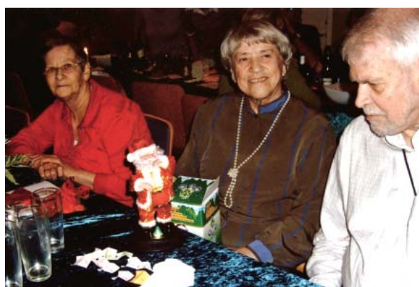
Foruden den gode mad var der også små julegaver.