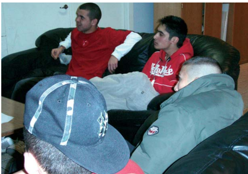
Tranedrengene i sofagruppen til uformel small talk.

„Tranens Drengene“ er meget imødekommende over for gæster, og man bliver smittet af den glæde og livslust, der bobler alle vegne. Så hvad med at lægge vejen forbi næste gang der er åbent hus? Ω