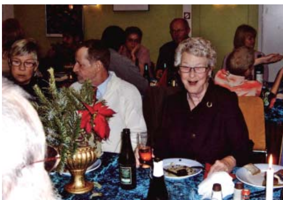
En glad formand for pensionistklubben 3'eren.