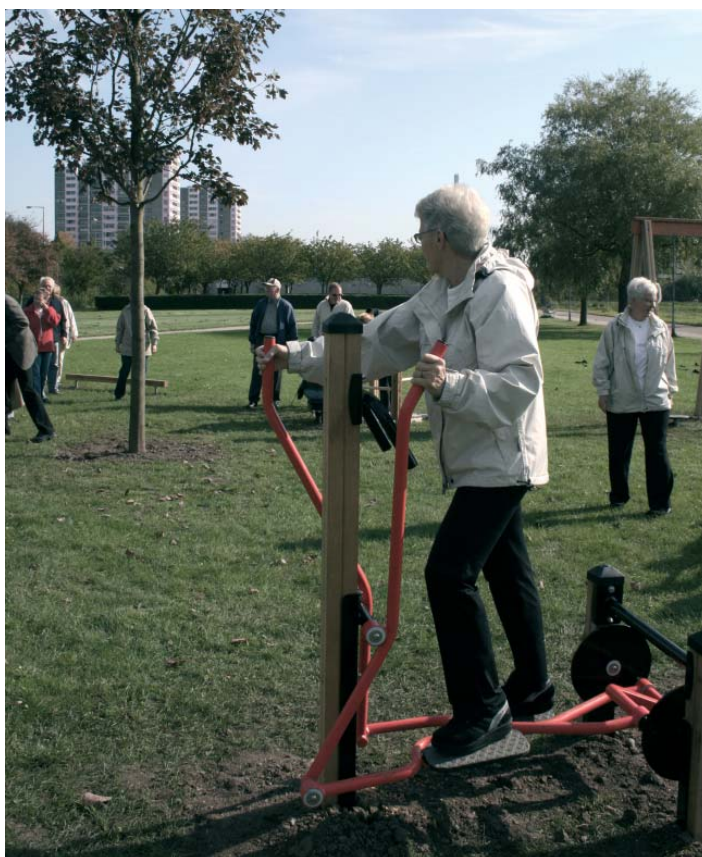
Vor nys etablerede motionsplads i Esplanaden kan naturligt indgå i det kommende KRAM-projekt.

Det er ikke alene i KRAM-bussen, aktiviteterne skal foregå. Kommunens forvaltninger vil igangsætte forskellige aktivite-