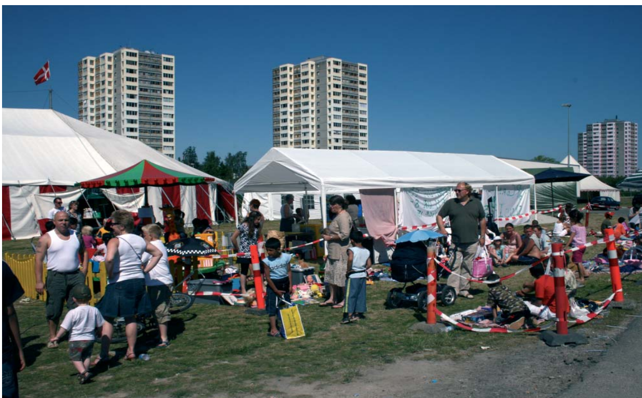
Kulturweekend afholdes hver sommer som regel i strålende solskin.

Dette arbejde fortsætter og vil forhåbentlig blive styrket med det formål, at foreningen får medlemmer fra hele kommunen. Brøndby Strand Gøglerne er sikre medspillere og måske med udvidede aktiviteter. Ω