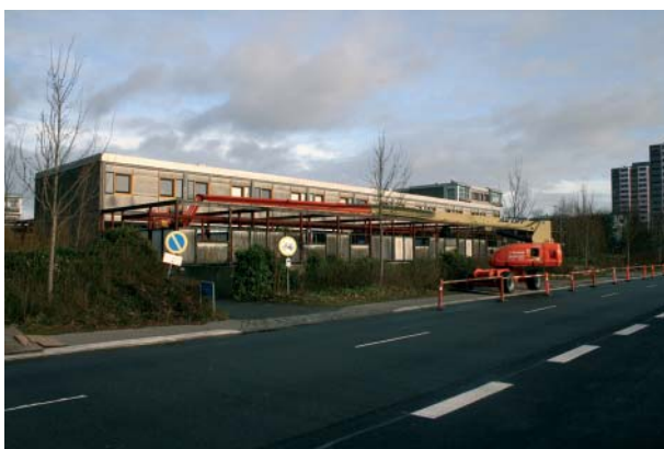
I PAB8 er man ved at afslutte udskiftningen af alle bevægelige vinduer samt have- og altandøre.

Her følger billeder af fire af byggepladserne i Stranden. Ω