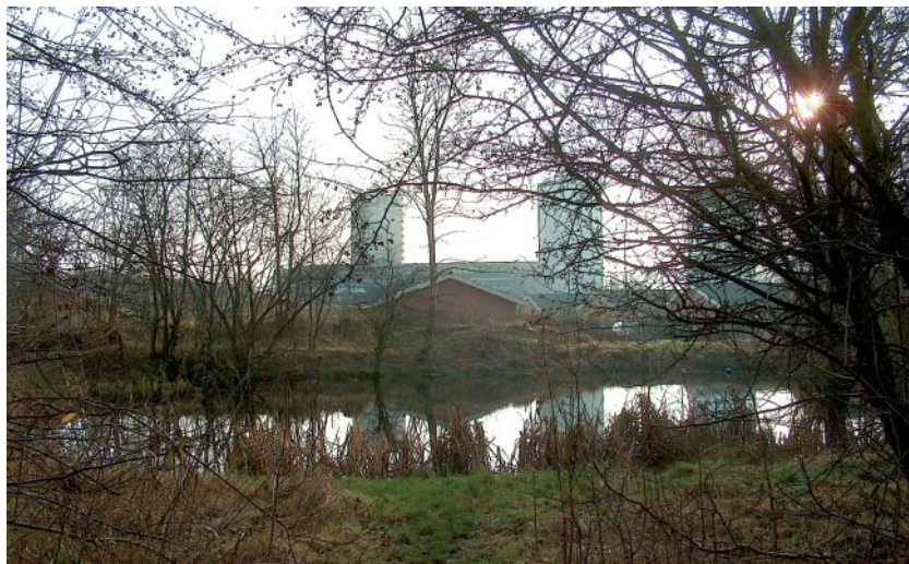
Man kunne næsten få lyst til at istemme: 'Ved landsbyens gadekær...'