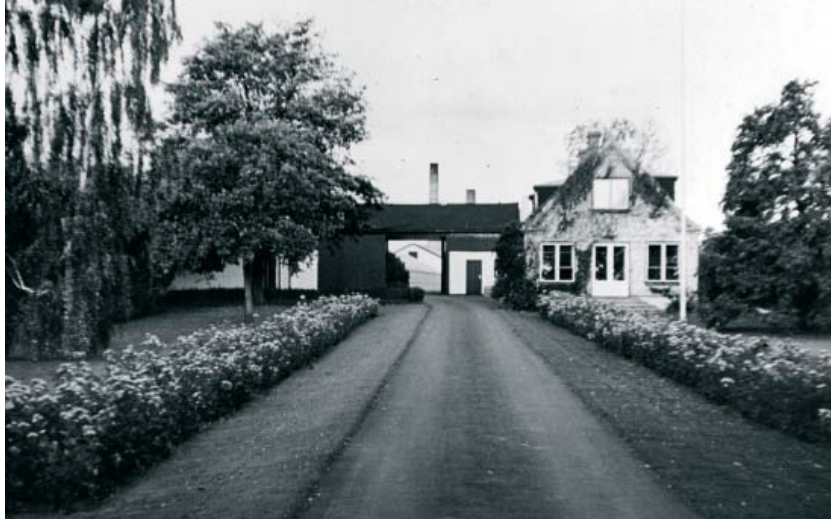
Gartneriet Kettehøj kunne før i tiden levere både roser og tulipaner.