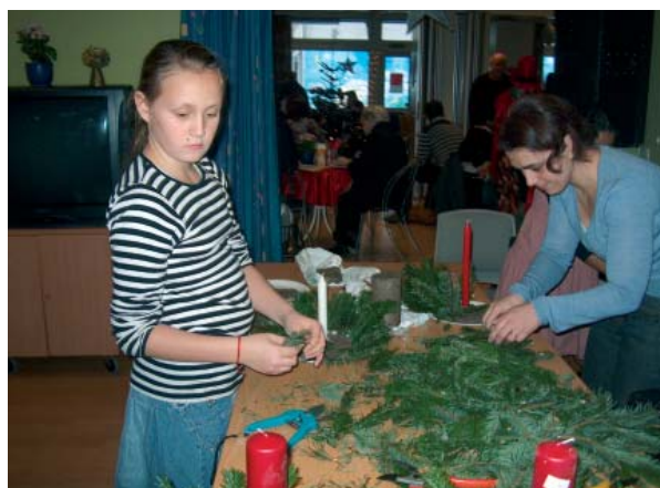
Børnene lavede fine dekorationer med gran og lys.