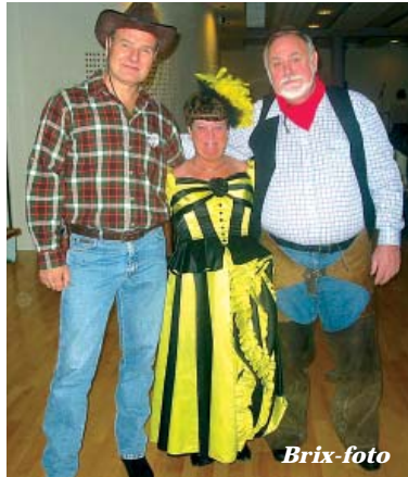
Fra en tidligere fest i Rheumhus.

Musikken leveres af PS2DUO. Salg af billetter foregår indtil fredag 8. februar i Rheumhus' åbningstid. Prisen for menu og musik er 95.00 kr. pr. person.