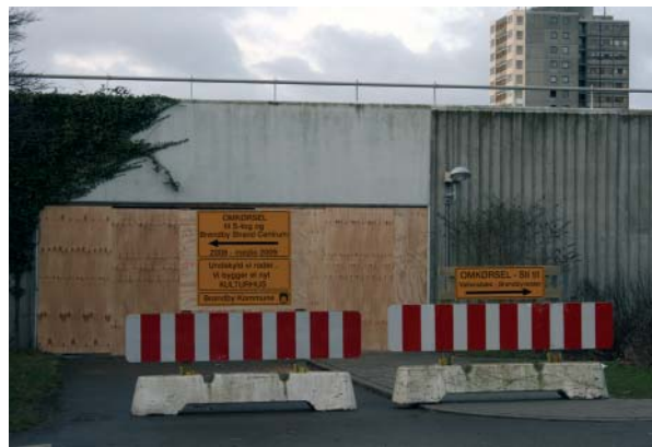
Kulturhuset, der har været så meget igennem siden tankerne for snart ti år siden satte gang i processen, spirer også snart. Det betyder dog visse trafikale ulemper på nogle af stisystemerne i byggeperioden.

Har du en go' idé? - Så har 'Herfra og videre' en mindre pulje penge til at støtte med. Kig forbi kontoret i Kisumparken 2 el. ring på 4354 2275 og lav en aftale. Mere til næste nummer . . .