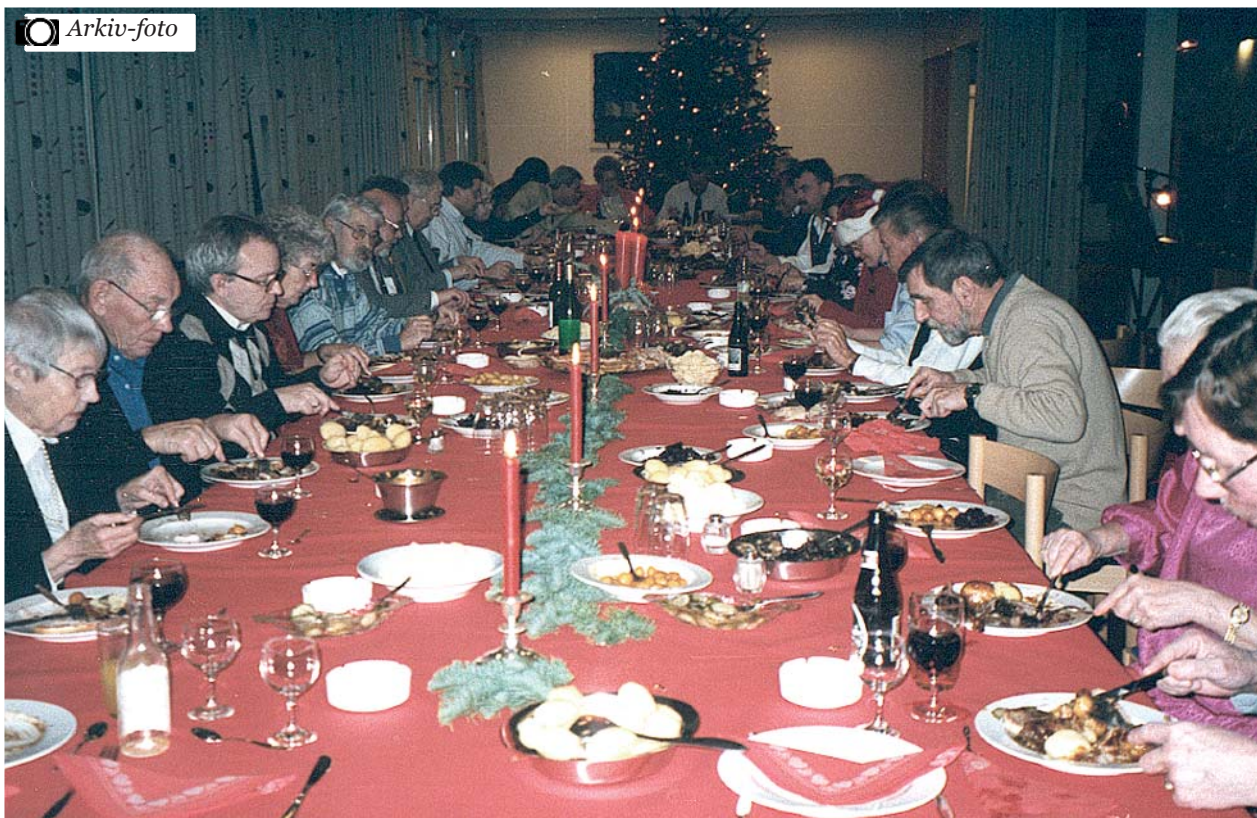
Det 'store varme julebord' med julemad og med juletræ i baggrunden fra en tidligere julefest i Perlen.

J ulefesten i Perlen fandt sted den 22. december fra kl. 18.00. Vi ankom til et smukt pyntet julebord - flot med lys og blomster. Jeg havde min søde nabo med og desværre sidder hun i kørestol. Det var bestemt ikke nogen hindring. Næh, - tværtimod var den bedste plads reserveret til min nabo.